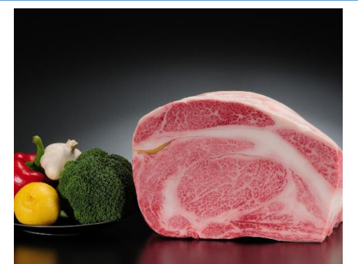
(写真はイメージです)

▲県内プロスポー ツチームサイン入 りグッズや県産品 などが抽選で当た ります！